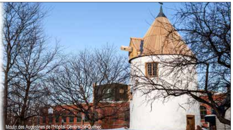
Moulin des Augustines de l'Hôpital-Général-de-Québec

810, Saint-Joseph Est Québec Québec Canada G1K 3C9 t. (418) 694. 6911 f. (418) 694. 0833 www.bfharchitectes.com