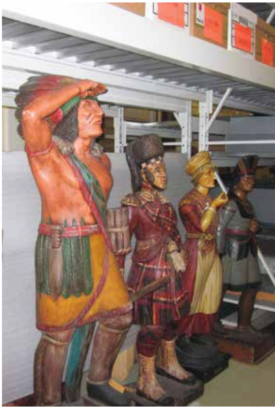
Coup d'œil aux réserves du Musée Stewart, situées au Centre des collections muséales à Montréal. On y trouve des artefacts témoignant de l'influence des civilisations européennes en Nouvelle-France et en Amérique.