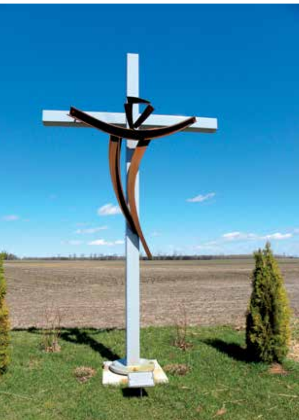
Cette croix qui se dresse à une intersection a été commandée à l'occasion du 100 e anniversaire de Saint-Bernard-de-Michaudville, en Montérégie, en 2008.