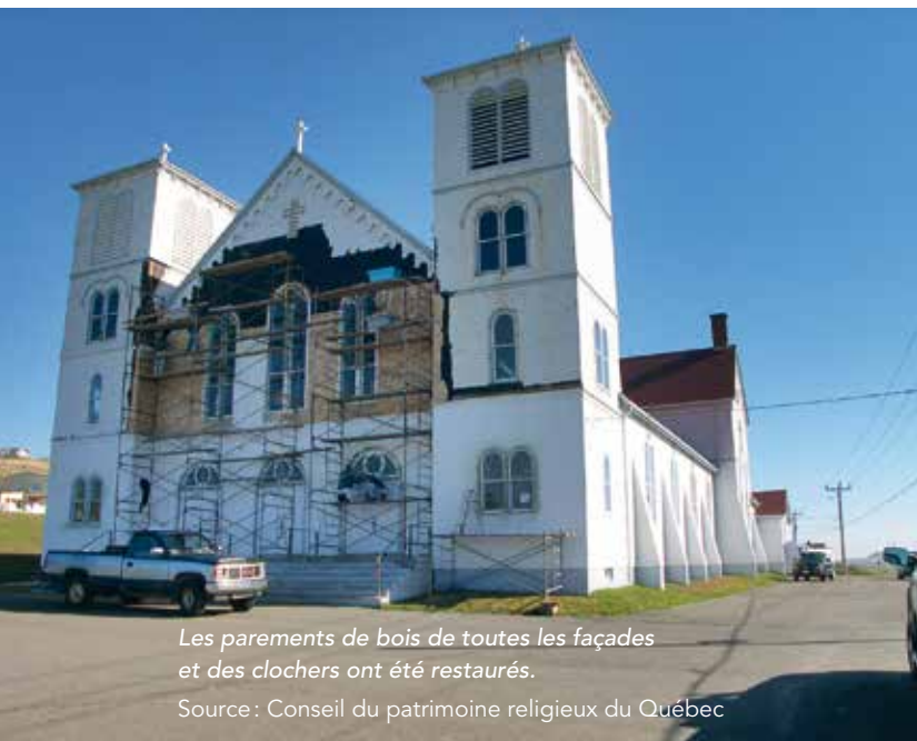
Les parements de bois de toutes les façades et des clochers ont été restaurés.