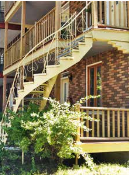
Des quartiers anciens comme Limoilou, à Québec, sont déjà denses, même si le gabarit de leurs bâtiments n'est pas particulièrement imposant.

bâti, certaines transformations affectent les permanences structurales. C'est le cas lorsqu'on modifie la trame viaire, ou lors du démembrement de grandes propriétés, du remembrement foncier ou d'un changement radical d'échelle.