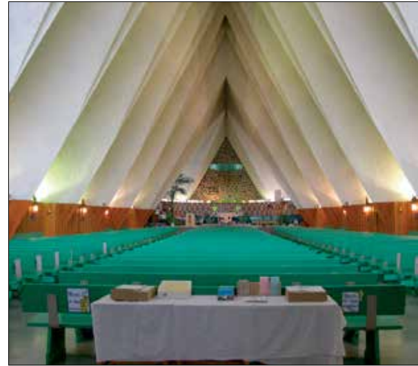
Imaginez quel défi ce fut de réaliser le toit plissé de l'église de Saint-Marc, dans l'arrondissement de La Baie, à Saguenay !