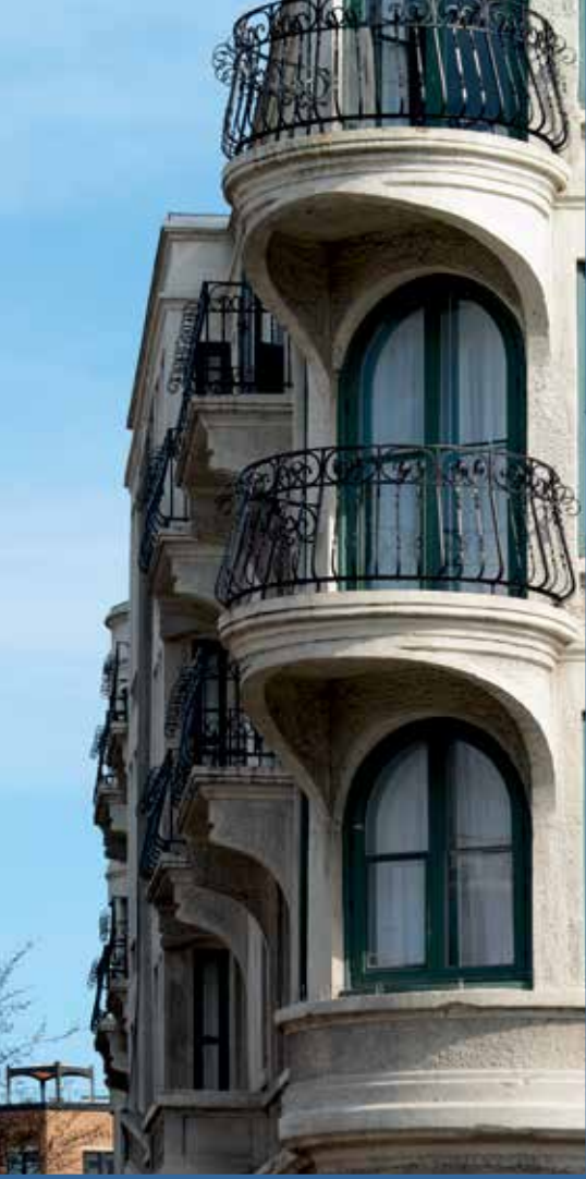
Les immeubles d'appartements imaginés par Joseph-Arthur Godin dans les années 1910 arborent leur squelette de béton armé en façade, comme cet édifice montréalais qui porte le nom de l'architecte.