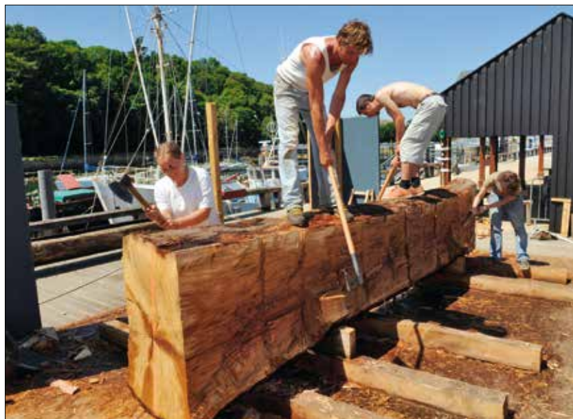
Sur le chantier naval des Ateliers de l'Enfer à Douarnenez, 11 jeunes bénévoles de divers pays ont relevé le défi de creuser à l'identique une pirogue monoxyle, sur le modèle d'une épave médiévale découverte près de Vannes en 1906.