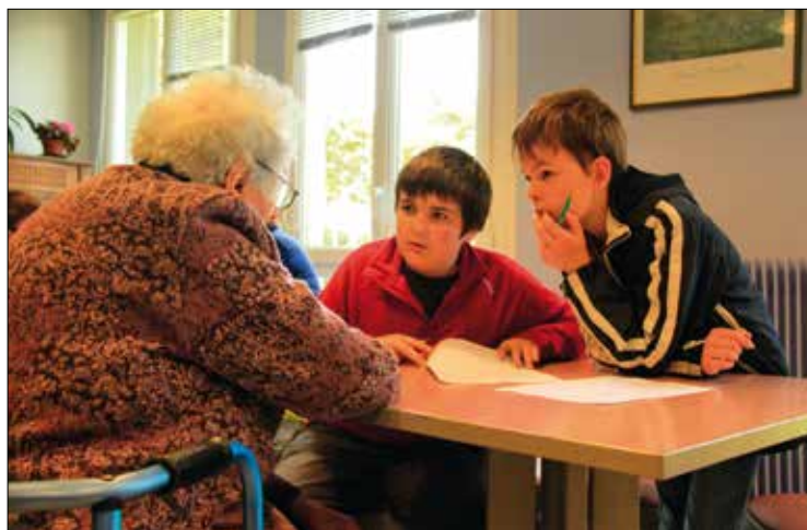
Le projet « L'Histoire et les histoires » a donné lieu à une rencontre intergénérationnelle dans le pays Centre Ouest Bretagne. Il y a été question du conte et de la gwerz (complainte en breton inspirée de faits divers).

La diversité des origines des participants témoigne de