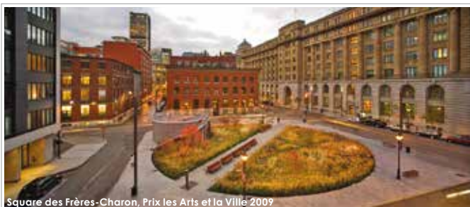
Square des Frères-Charon, Prix les Arts et la Ville 2009