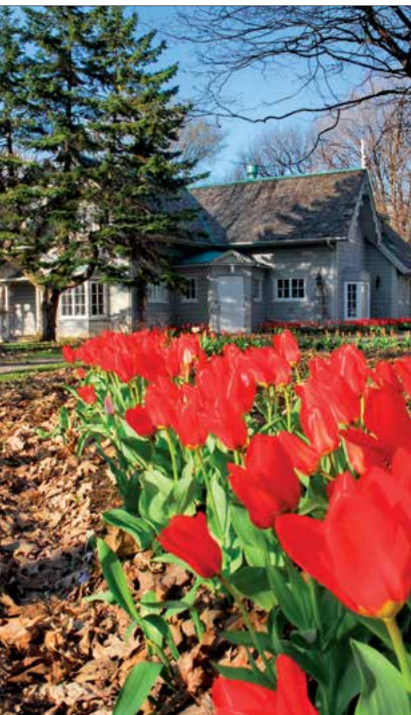
La villa pittoresque cherche à se fondre dans la nature qui l'entoure, comme en témoigne la villa Bagatelle.