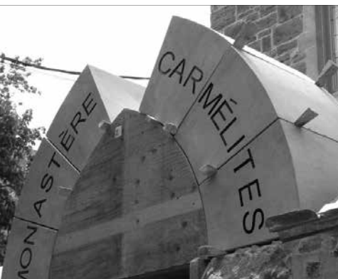
Les chaperons ont été reconstruits, parfois en béton préfabriqué ou en cuivre étamé, parfois en pierre de taille, comme ici.