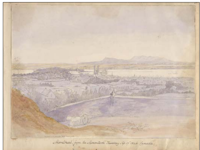
Ayant gravi le mont Royal, Seymour saisit une vue panoramique de Montréal. On distingue les clochers de l'église Notre-Dame et les Montérégiennes en arrière-plan.

Le lendemain 18 septembre, Michael Seymour est de nouveau à Québec. Il arpente le site de l'ancien parlement – où ont siégé les parlementaires du