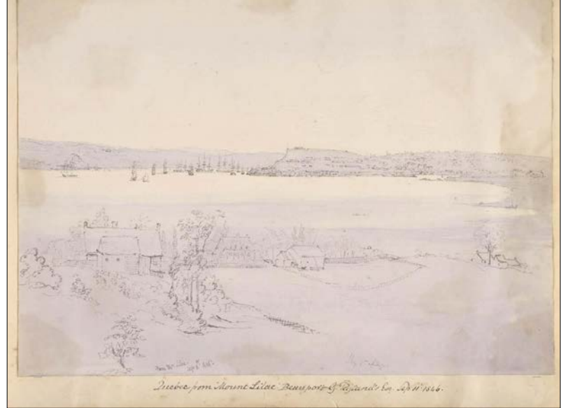
Lors de son passage à la villa Mount Lilac de Beauport, Seymour ébauche une vue de Québec, avec au premier plan des maisons et des bâtiments de ferme typiques de l'avenue Royale.

C'est à Montréal que la frégate jette l'ancre le 15 septembre. Le lendemain, alors qu'il se trouve sur l'île Sainte-Hélène, Seymour dresse le profil de Montréal, devenue en 1844 la deuxième capitale du Canada-Uni. Le 17, notre homme fait l'ascension du mont Royal d'où l'on a une vue imprenable sur la ville. Il résulte de cette excursion une vue panoramique de la cité en pleine expansion d'où pointent plusieurs clochers – dont ceux de l'église Notre-Dame –, et derrière la-