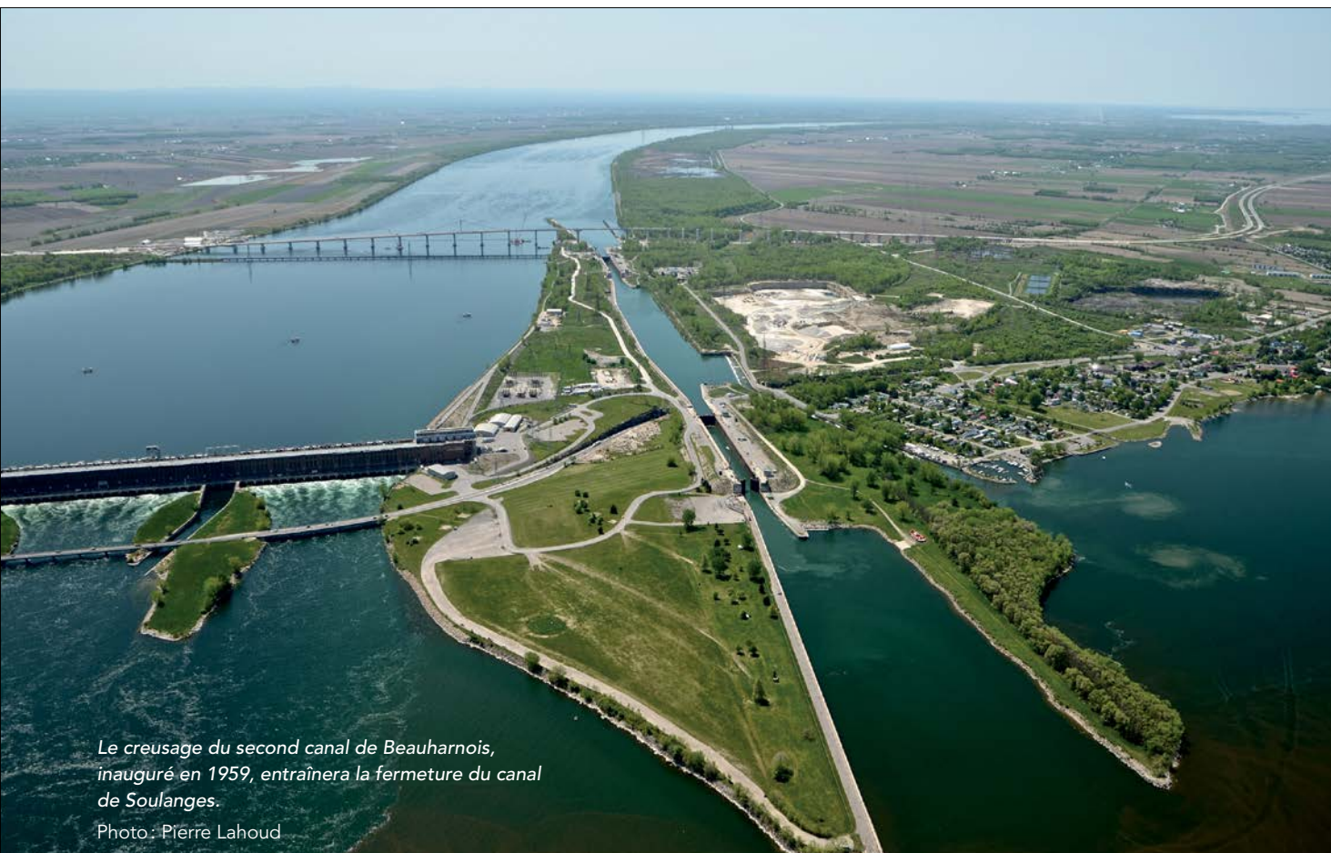
Le creusement du second canal de Beauharnois, inauguré en 1959, entraînera la fermeture du canal de Soulanges.