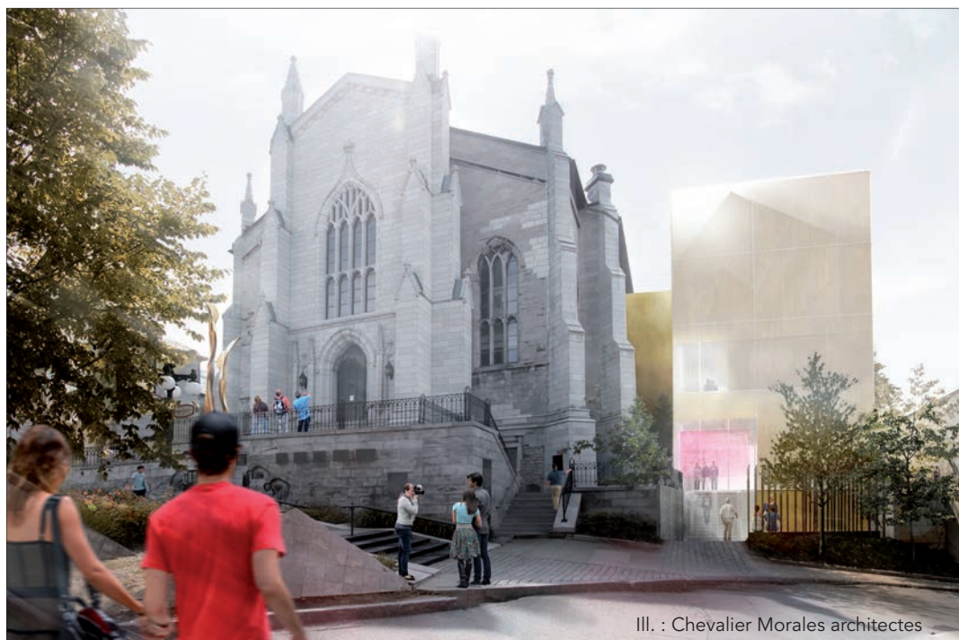
Ill. : Chevalier Morales architectes

La Maison de la littérature ouvrira ses portes à l'automne 2014. Elle formera un nouveau pôle littéraire dans le Vieux-Québec, en association avec la Literary and Historical Society of Quebec, qui anime le Morrin Centre, un bâtiment patrimonial