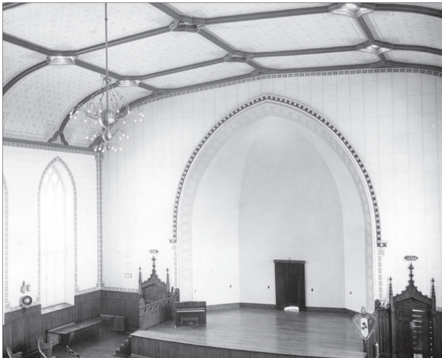
L'intérieur du temple Wesley avant sa transformation en salle de spectacle vers 1950. La Maison de la littérature tirera avantage de son imposant volume.