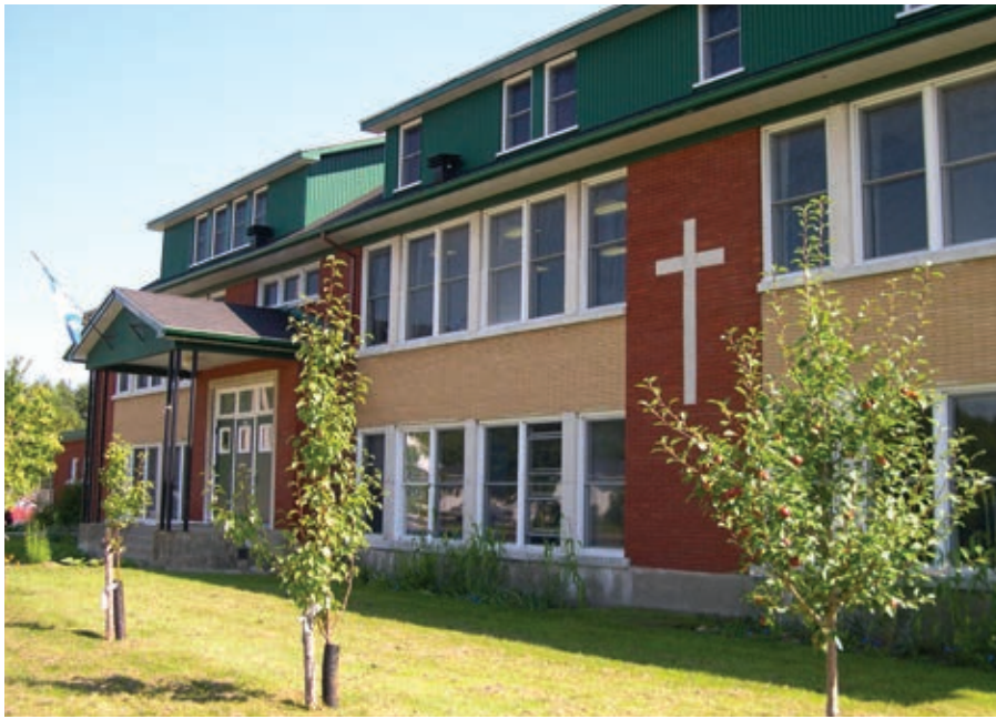
Afin d'éviter la fermeture de l'école de Saint-Joachim, des intervenants se sont unis pour mettre en place une école internationale, devenue depuis un élément identitaire du village.