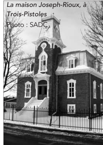
La maison Joseph-Rioux, à Trois-Pistoles