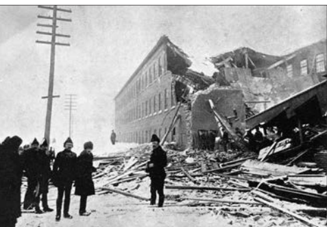
Incendie à Saint-Roch, en 1891