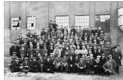
Employés et dirigeants de la brasserie Dow en 1931

quartier Sud-Ouest de Montréal et dans celle du Québec, l'exposition témoigne du passé industriel et brassicole de la métropole sur plus de 200 ans. Info: 514 872-9150 ou pacmusee.qc.ca