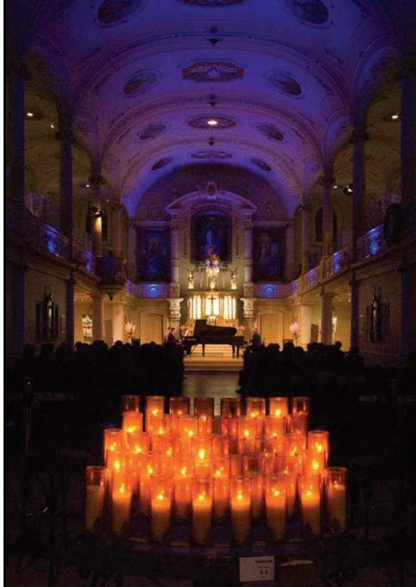
L'église Notre-Dame-de-Jacques-Cartier, dans le quartier Saint-Roch à Québec, accueille divers spectacles et activités, en plus des messes du dimanche. En septembre dernier, on inaugurerait officiellement l'Espace Hypérion, le nom donné à la salle.

Même si, par leur taille et leur organisation spatiale, les couvents se prêtent mieux que les églises à ces nouvelles fonctions, ils posent leur lot de défis. Souvent, soit les ailes de l'édifice sont trop étroites pour qu'on y aménage des unités de chaque côté d'un corridor central, soit le bâtiment est trop large pour que des unités le traversent. Une solution à ce problème serait d'implanter toutes les pièces de services (salle de bain, rangement, salle de lavage) au centre ; les espaces de vie (salon, salle à manger, cuisine, bureau) près des grandes fenêtres