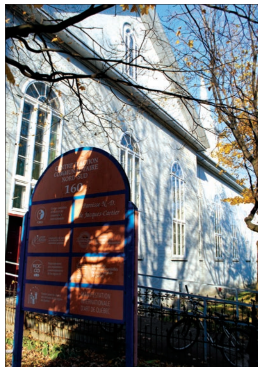
Des ateliers d'artistes et des organismes communautaires logent dans les jubés et les bas-côtés de l'église Notre-Dame-de-Jacques-Cartier.