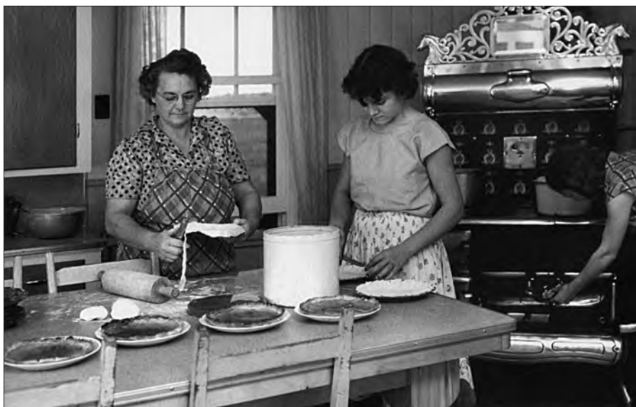
Il fut une époque où les savoir-faire culinaires se transmettaient de mère en fille.