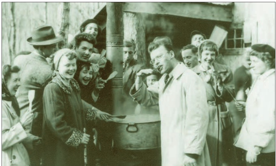
Le temps des sucres était propice aux rassemblements familiaux ou amicaux.