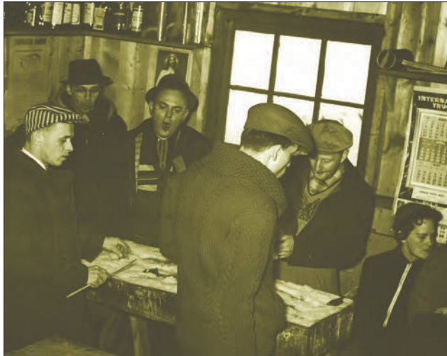
Val-des-Monts, printemps 1958