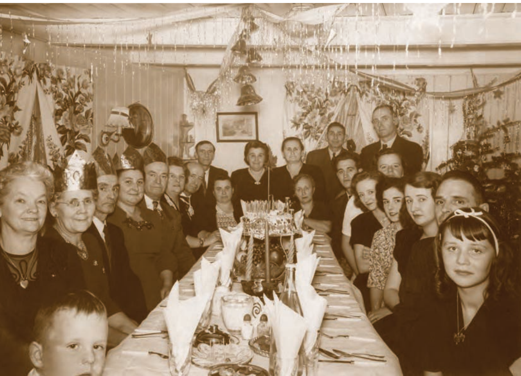
La fête des Rois mettait un terme aux festivités et aux repas liés à Noël et au jour de l'An.

Source : Musée de la mémoire vivante, coll. Famille Chamard, P2008-7-1