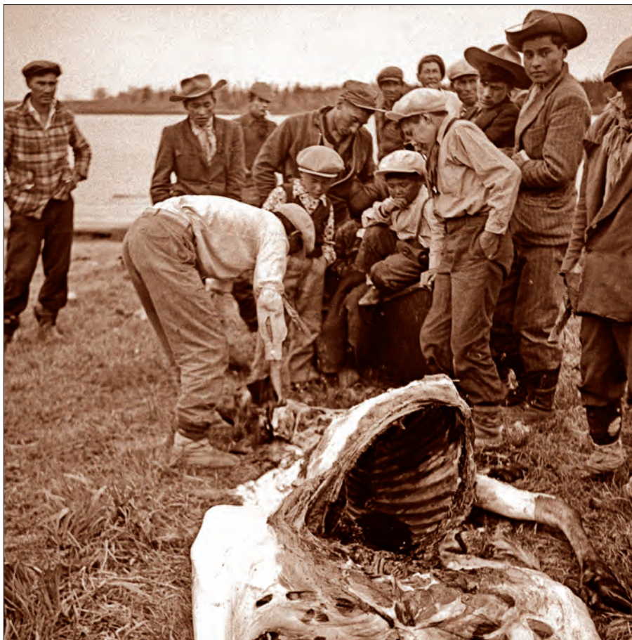
En hiver, les nations de langue algonquienne avaient un penchant pour le gros gibier. Ici, le dépeçage d'un orignal à la réserve de Waswanipi en 1955.

Nos ancêtres français sont donc arrivés au Québec avec ce bagage culturel global et un petit accent normand. En prenant contact avec les Algonquiens campés à Québec, ils ont aussitôt adopté la sagamité, un plat à base de semoule de maïs. Sagamité vient du mot algonquin sagamitew , qui