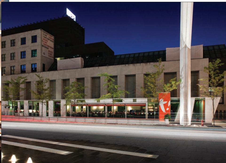
Les Vitrines habitées qui logent des restaurants brisent habilement le mur aveugle du Musée d'art contemporain. Les clients qui y mangent sont à la fois témoins et acteurs du spectacle de la rue.