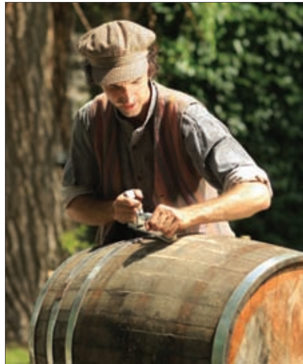
La Maison Saint-Gabriel organise diverses activités de transmission et de valorisation de pratiques et de métiers artisanaux en voie de disparition. Ici, un tonnelier à l'œuvre.

riel. En 2007, le Musée québécois de culture populaire à Trois-Rivières a créé, avec le Musée de la vie wallonne à Liège, une exposition consacrée à la transmission des savoir-faire artisanaux au Québec et en Wallonie. Pointe-à-Callière, musée d'archéologie et d'histoire de Montréal, vient de présenter une exposition sur les contes et légendes de l'Amérique française, et le Musée de la civilisation, à Québec, met en scène sept conteurs et conteuses reconnus qui présentent chacun un conte lié à l'un des sept péchés capitaux, à l'aide d'objets provenant des collections de l'institution. Certains musées vont jusqu'à organiser des activités culturelles dans le but de transmettre des traditions, faisant participer les artisans et les porteurs de traditions. La Maison Saint-Gabriel, à Montréal, offre à ses visiteurs une programmation annuelle d'activités de transmission et de revitalisation de pratiques, de coutumes et de métiers artisanaux en voie de disparition. À la fin de chaque mois d'août, Pointe-à-Callière organise un marché public du XVIII e siècle. Les producteurs et les commerçants, habillés en costumes d'époque, attirent des dizaines de milliers de visiteurs qui viennent acheter des produits agricoles locaux.