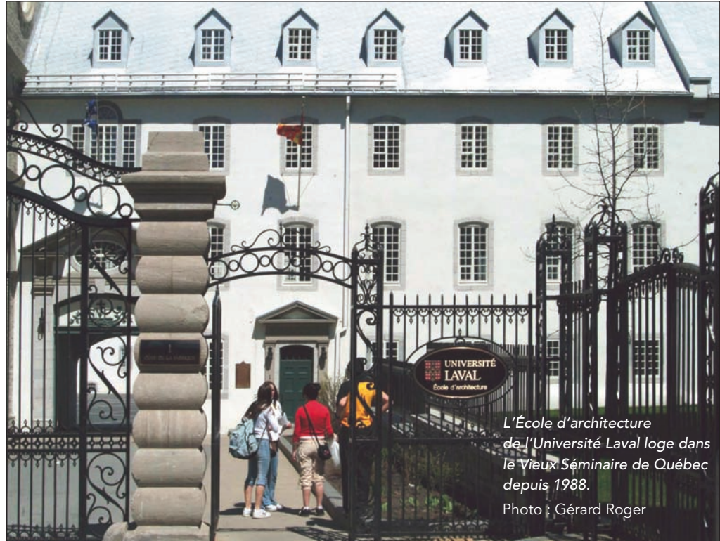
L'École d'architecture de l'Université Laval loge dans le Vieux Séminaire de Québec depuis 1988.

Fondée dans un contexte de changement social, culturel et économique, l'École d'architecture est animée par des professeurs qui contribuent directement à l'édification du patrimoine moderne du Québec. Dès la fin des années 1960, de jeunes enseignants s'engagent dans les débats publics et jettent les bases de nouvelles conceptions de