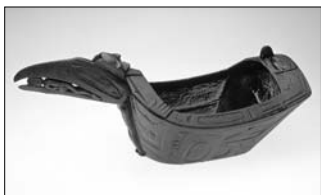
Bol haïda aux nombreux détails sculptés, 1800-1850