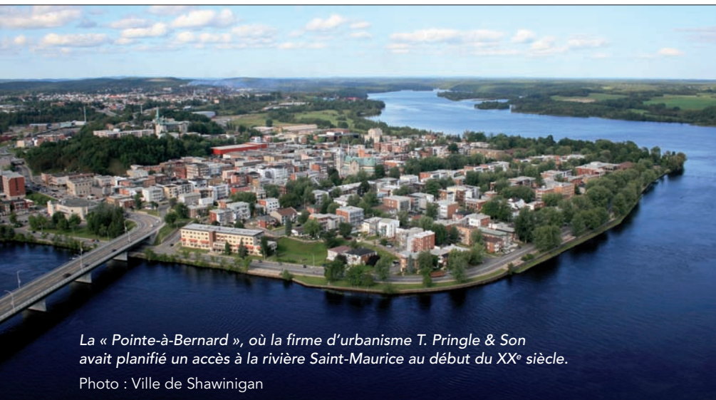
La « Pointe-à-Bernard », où la firme d'urbanisme T. Pringle & Son avait planifié un accès à la rivière Saint-Maurice au début du XX e siècle.