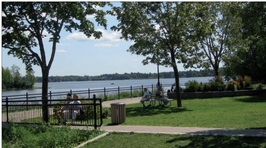
La promenade Paul-Sauvé longe la rivière des Mille-Îles, à l'embouchure de la rivière du Chêne.

Les travaux ont consisté à réaménager le terrain situé derrière l'église et la mairie,