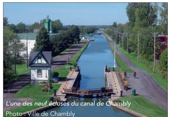
L'une des neuf écluses du canal de Chambly

Reliant Chambly à Saint-Jean-sur-Richelieu sur une distance d'un peu moins de 20 km, le canal compte neuf écluses,