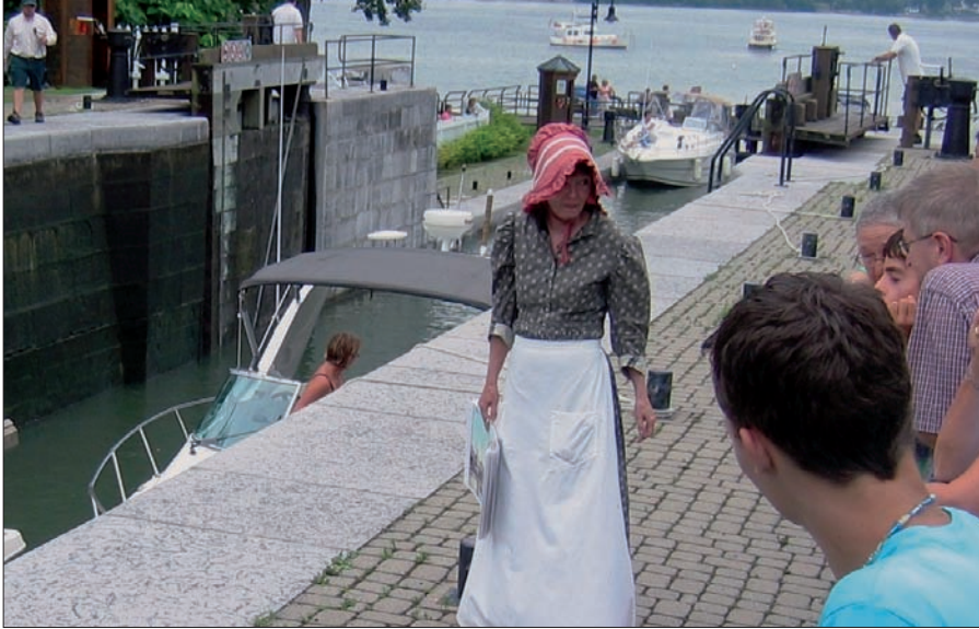
Guide-interprète incarnant un personnage marquant de l'histoire de la ville.