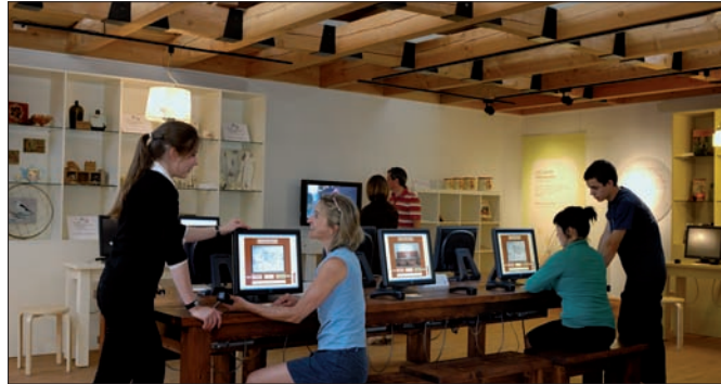
Exposition « Souvenirs de table »

Le patrimoine immatériel tient le haut du pavé dans ce musée où les témoignages et les anecdotes de gens « ordinaires » contribuent à garder notre mémoire vivante. On peut d'ailleurs y enregistrer un souvenir de son cru ! Située sur le site de l'ancien manoir seigneurial de Philippe Aubert de Gaspé, l'institution propose aussi une exposition de photos des années 1850 à 1950, « Objectif mémoire », jusqu'au printemps 2011.