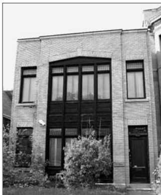
Le studio Nincheri