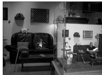
Quand l'atelier devient l'œuvre, saynète de Quinze

Jusqu'au 27 mars 2011, le Musée québécois de culture populaire présente « La face cachée de Quinze », une exposition rassemblant des œuvres de cet artiste de même qu'une partie de sa collection d'art populaire. Quinze réalise des saynètes qu'il sculpte dans le bois et égaye de couleurs vives. Si ses sujets s'apparentent à ceux de l'art populaire, il puise également ses influences du côté de l'art actuel et contemporain. L'exposition comprend sept installations qui mettent en lumière l'interrelation entre son travail de créateur et sa passion de collectionneur. Trois-Rivières. Info : 819 372-0406 ou www.culturepop.qc.ca