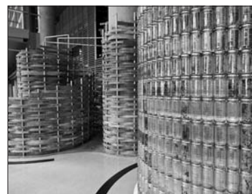
Murmures dans la main du temps, du collectif C-M-R, et Vers tissés serré, de Menkès Shooner Dagenais LeTourneux architectes