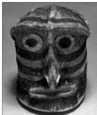
Tête à deux visages (tapa)

À Pointe-à-Callière jusqu'au 14 novembre, « Île de Pâques, le grand voyage » réunit 200 objets provenant des plus prestigieux musées internationaux. L'exposition invite à la découverte de l'histoire et de la culture du peuple rapanui (le plus isolé de la planète) : son quotidien, son organisation, son savoir, sa production et ses croyances. On peut entre autres y admirer deux des sept figurines à ossature de roseau recouverte de tapa cousu et peint de plusieurs couleurs répertoriées dans le monde. Elle présente aussi un film tourné en 1934-1935 lors de la mission de recherche de l'archéologue belge Henri Lavachery et de l'ethnologue franco-suisse Alfred Métraux. Montréal. Info : 514 872-9150 ou www.pacmusee.qc.ca