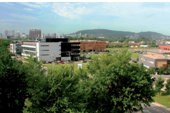
Le Technopôle Angus a fait du développement durable son mantra. Ce parc d'entreprises montréalais espère recevoir une certification LEED ND pour l'aménagement des quartiers.