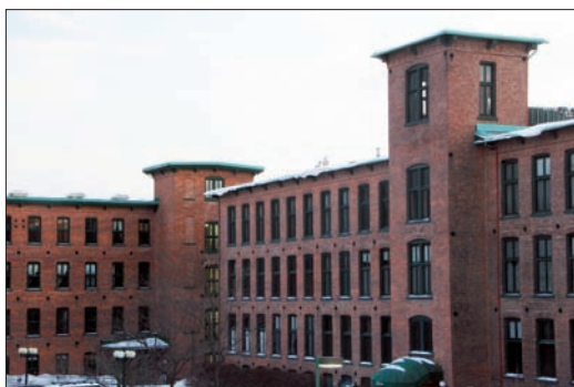
Sise au coin des rues King Ouest et Belvédère, à Sherbrooke, l'usine textile Paton (en haut en 1857) a été convertie en complexe immobilier de 1983 à 1985. Il s'agit d'une des premières interventions de recyclage de bâtiment industriel au Québec.