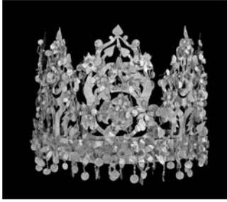
Couronne en or découverte au site de Tillia Tepe