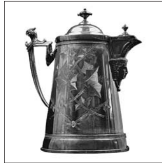
Le pichet était un élément important du buffet victorien. Celui-ci date de 1868.