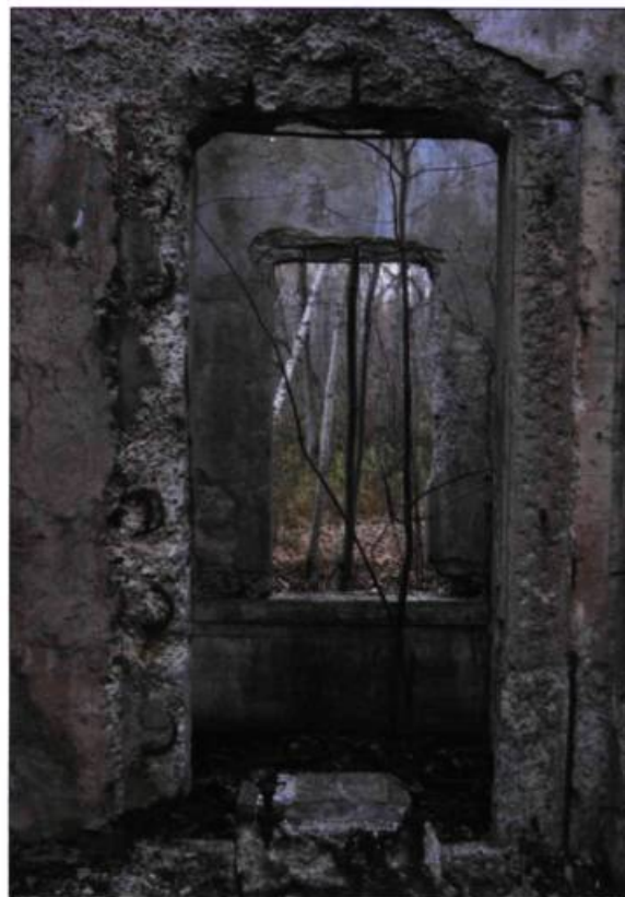
Ruines d'une fabrique de bombes abandonnée à Blainville