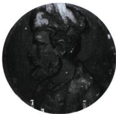
Le médaillon de Jacques Cartier, un bas-relief datant d'environ 1704, a été découvert en 1908 dans une maison de Cap-des-Rosiers.