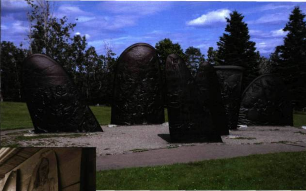
Le monument à Jacques Cartier est situé dans un parc devant le Musée de la Gaspésie.