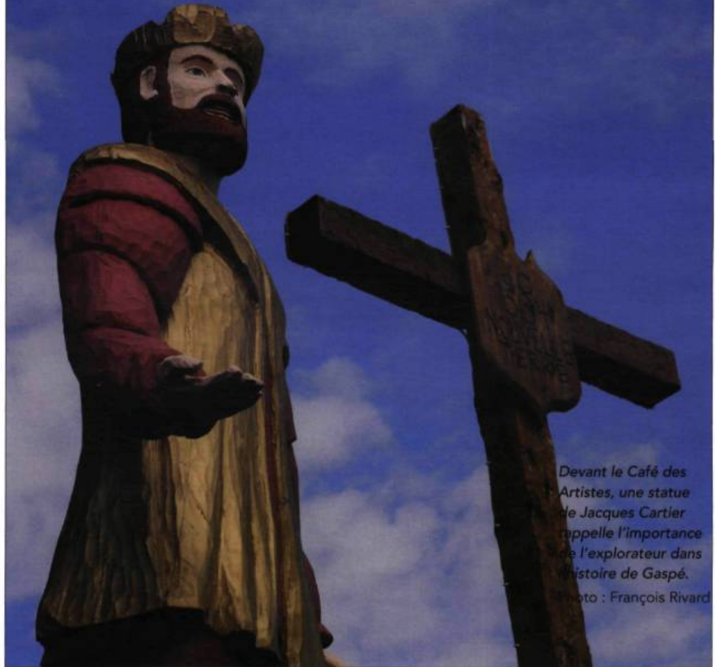
Devant le Café des Artistes, une statue de Jacques Cartier rappelle l'importance de l'explorateur dans l'histoire de Gaspé.

Été 1534 : Jacques Cartier explore le golfe du Saint-Laurent et la Gaspésie, puis érige une croix à Gaspé, geste d'appropriation d'un nouveau monde au nom du roi de France. À l'occasion du 475 e anniversaire de la ville, ces actions retrouvent une signification historique de premier plan. Parcours mémoriel d'un explorateur mythique.