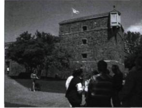
Visite au fort de Chambly