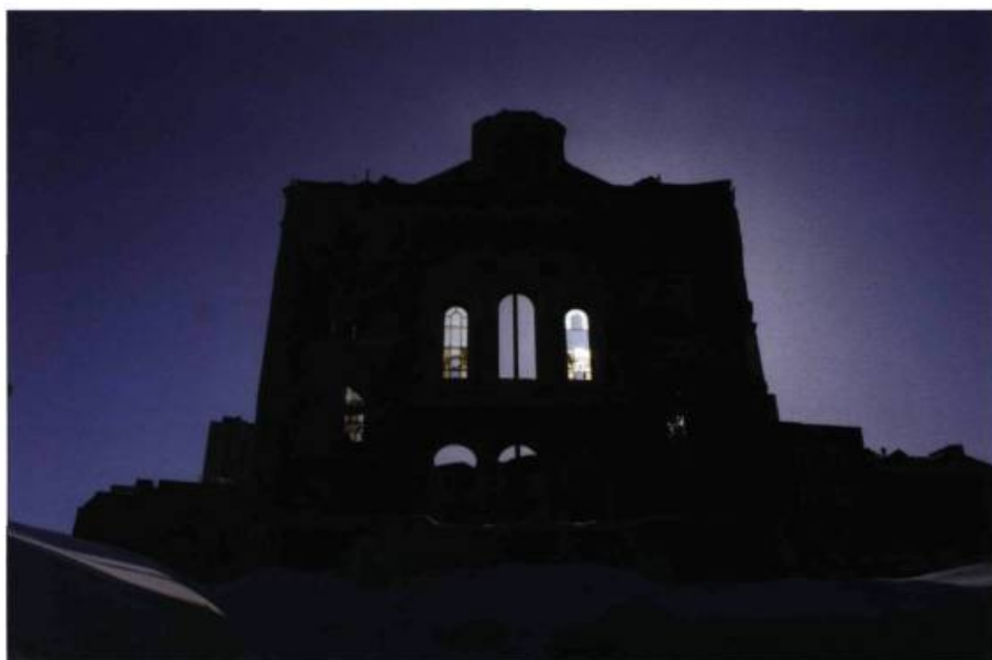
Façade dépouillée de l'église Saint-Vincent-de-Paul.