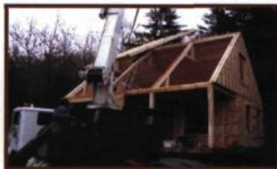
Chalet à Grosse-Roche, tech.arch. Gilles Pelletier