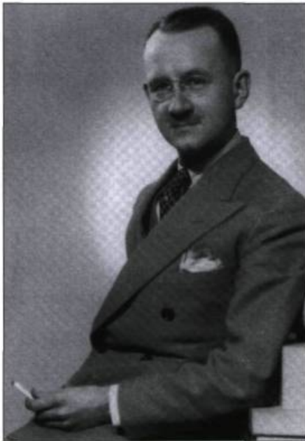
Photo : Paul Girard (1949), Bibliothèque et Archives nationales du Québec, Centre d'archives de Montréal, Fonds Ministère de la Culture et des Communications

les différents ministères et le réseau hôtelier de la province.