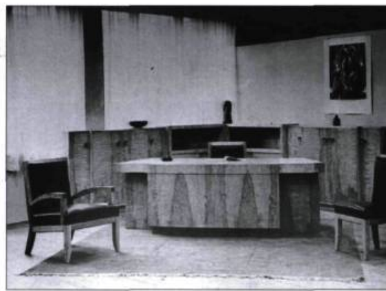
Mobilier de bureau conçu par le professeur Henri Beaulac.

Par la suite, le mobilier produit à l'École reflète les différentes tendances à la mode de 1930 à 1958, soit le style International, le design d'avant-garde scandinave et l'esthétisme industriel. Au fil des ans, les formes et les lignes des meubles et des décors s'allègent et s'épurent en s'éloignant