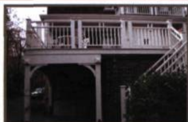
Terrasse Outremont 2007, doubleG architectes

Gloria Lesser, École du meuble, 1930-1950 : la décoration intérieure et les arts décoratifs à Montréal , Montréal, Château Dufresne, Musée des arts décoratifs de Montréal, 1989, 119 p.