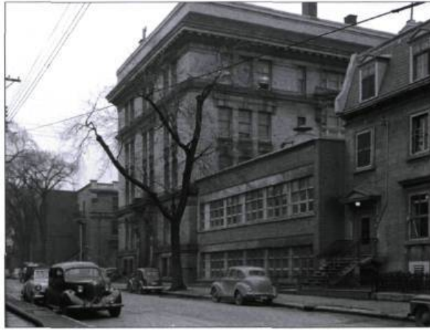
Dès 1940, l'École du meuble de Montréal occupe l'ancienne Académie Marchand. L'annexe moderne est l'œuvre de l'architecte Marcel Parizeau (1941).