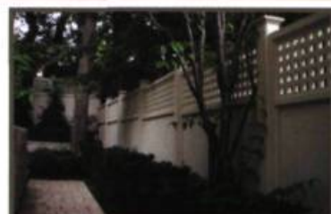
Clôture Westmount, Claude Cormier architecte paysager