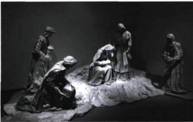
Crèche grandeur nature réalisée par Anne Robert, designer de l'exposition.

Jusqu'au 6 janvier, l'Institut canadien de Québec présente la 24 e exposition « Crèches d'ici et d'ailleurs ». Cette année, l'événement gratuit se déroulant à la Bibliothèque Gabrielle-Roy s'attarde particulièrement au personnage de saint Joseph, à sa vie et à son métier de charpentier. Québec. Info : 418 641-6789 ou www.bibliothequesdequebec.qc.ca