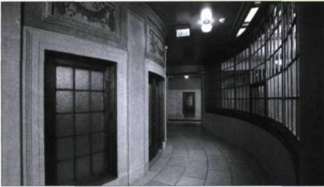
Vue intérieure de la Cour d'appel du Québec (édifice Ernest-Cormier). Ce projet a été réalisé par la firme d'architectes Lemay dans le Vieux-Montréal en 2004.

Fondée en septembre 1957, la firme d'architecture Lemay célèbre 50 ans de réalisations en terre québécoise et étrangère. Préoccupée par la valorisation du patrimoine bâti et paysager, la firme s'affaire au développement de nouveaux espaces et au maintien de bâtiments historiques. Les festivités se sont déroulées à ses bureaux de Montréal, nouvellement aménagés dans un immeuble centenaire d'un ancien quartier industriel.