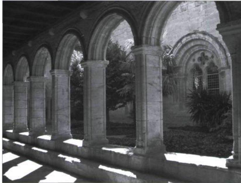
La cour intérieure du monastère de Poblet. L'établissement accueille près de 200 000 visiteurs chaque année.