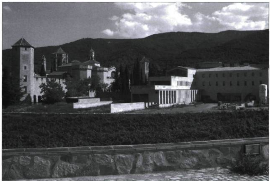
Le monastère de Poblet, situé à une heure de Barcelone, a été remis en état et animé avec le concours d'une communauté de moines cisterciens et de l'État. À droite, l'hôtellerie moderne, très bien intégrée à l'ensemble.