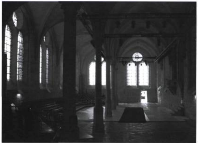
Le réfectoire de l'abbaye de Royaumont a été conservé, tout comme le cloître et le jardin médiéval. Son espace scénique se prête tout à fait aux activités du Centre culturel de rencontre.