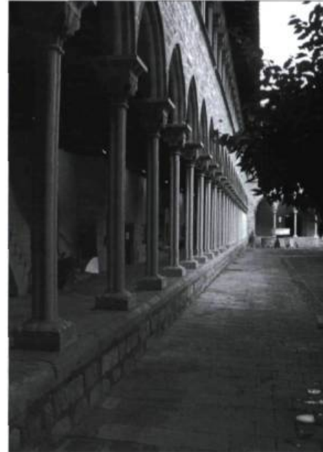
Propriété des sœurs clarisses, le monastère de Pedro Alba de Barcelone abrite maintenant un musée en plus de loger les religieuses.

Le monastère de Poblet, à une heure de Barcelone, a été partiellement détruit et spolié en 1840. Au sortir de la guerre civile, un siècle plus tard, une communauté de moines cisterciens revient s'y établir avec l'aide de l'État. En plus de la restauration du gros œuvre prise en charge par le ministère de la Culture de la Catalogne, le gouvernement fournit à la communauté des moyens de subsistance afin de lui permettre de préserver l'esprit du lieu et d'organiser des activités qui mettent le monastère en valeur. Un