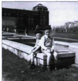
L'exposition « Souvenirs de famille du Jardin botanique » regroupe des photos que des visiteurs ont prises.

Information : (514) 872-1400 ou www.ville.montreal.qc.ca/jardin