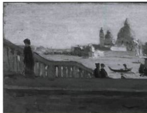
La Salute vue du Ponte della Paglia, Venise, de Clarence Gagnon, huile sur panneau de bois, 15,8 x 23 cm, 1905.

« Clarence Gagnon, 1881-1942. Rêver le paysage » est la première rétrospective consacrée à cet artiste québécois depuis l'exposition ayant souligné son décès en 1942. Le parcours de l'artiste est retracé à travers 150 œuvres, majoritairement des peintures, mais aussi des gravures et des croquis. Le visiteur passe de ses premières réalisations, qui s'inscrivent dans la lignée du mouvement de renouveau de l'estampe originale au Canada et qui l'ont fait connaître en Europe, à ses illustrations lui ayant valu une réputation internationale, notamment celles des romans Grand Silence blanc , de Frédéric Rouquette (1928), et Maria Chapdelaine , de Louis Hémon (1933), sans oublier ses célèbres paysages de Charlevoix. Jusqu'au 10 septembre, au Musée national