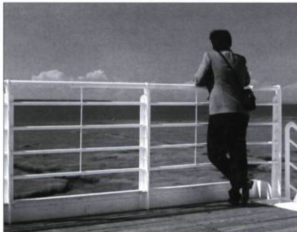
Observer le mouvement des marées ou la faune ailée est devenu une activité des promeneurs.

■ Aline Blais est responsable des communications à la Ville de Rimouski et Alain Tessier y est responsable de l'urbanisme.