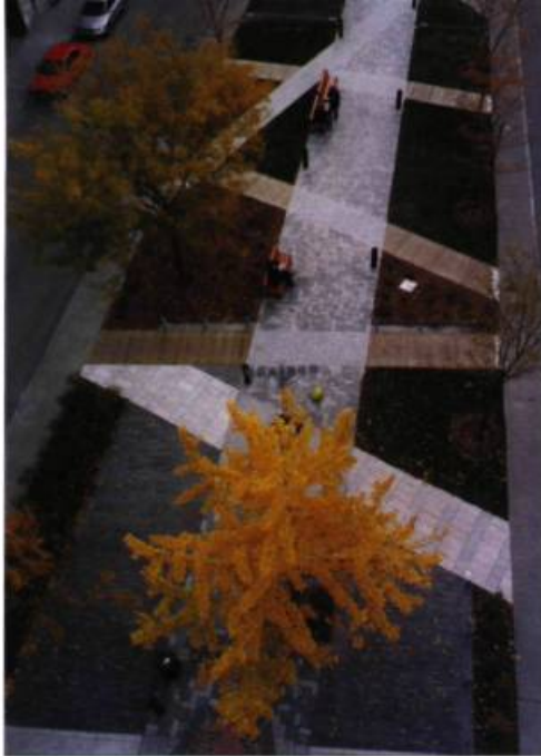
Vue de la place D'Youville. On aperçoit au centre le marquage du collecteur William par un large trottoir en granit.