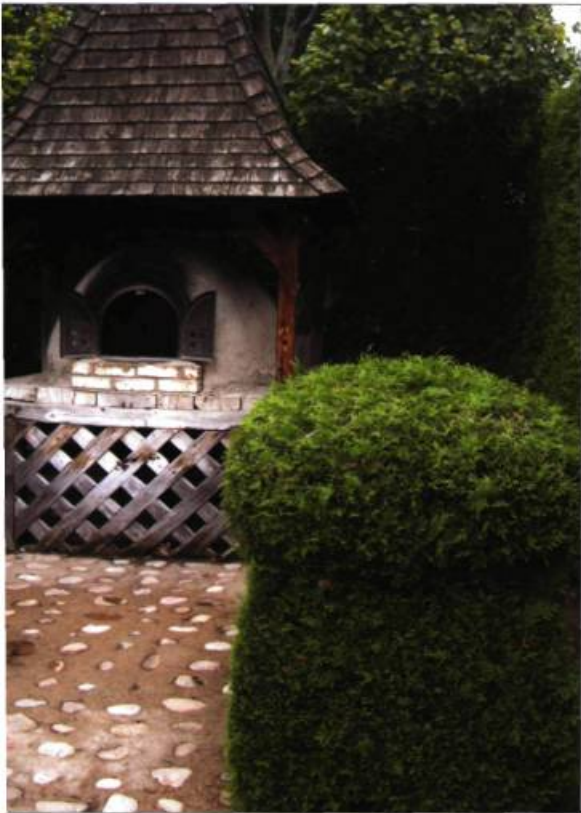
Topiaire en forme de pain au Jardin de la boulangère.