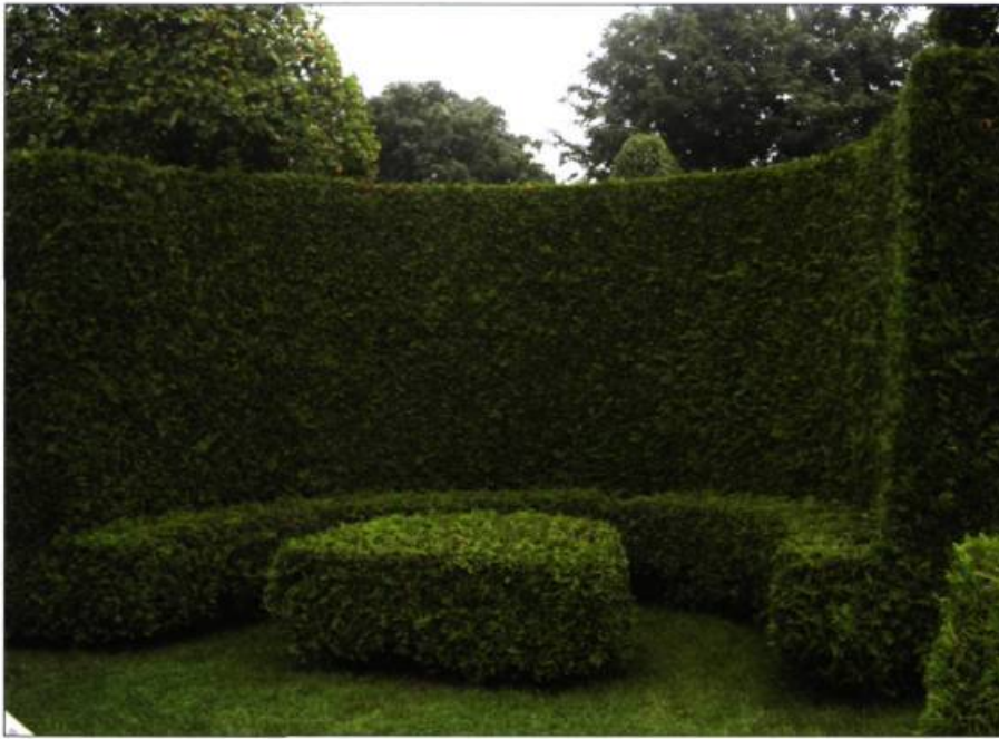
Ameublement de verdure au Jardin des invités.