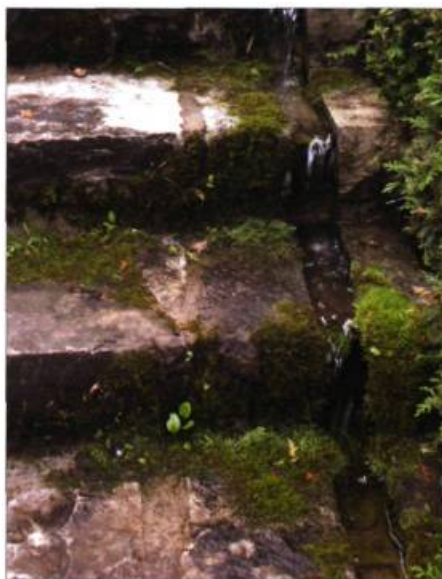
D'étroits canaux parcourent les marches des escaliers qui conduisent à la Salle des bassins.