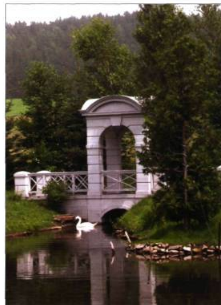
Le lac des Cygnes et le pont des Quatre-Vents. À l'arrière-plan, le paysage charlevoisien.