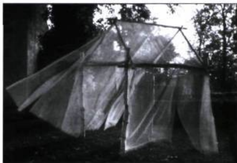
La carrée du sourcier.