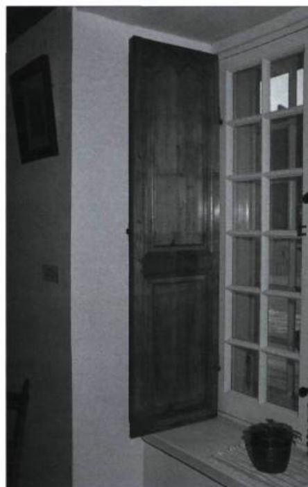
Les fenêtres à battants possédaient souvent des volets intérieurs. Ceux-ci sont ornés de caissons à panneaux soulevés et chantournés pour celui du haut.

Des battants qui ferment mal peuvent s'expliquer par des excès de peinture à des endroits qui ne devraient pas être peints, comme l'assemblage du montant à noix et contre-noix et celui à mouton et gueule de loup. Du mastic