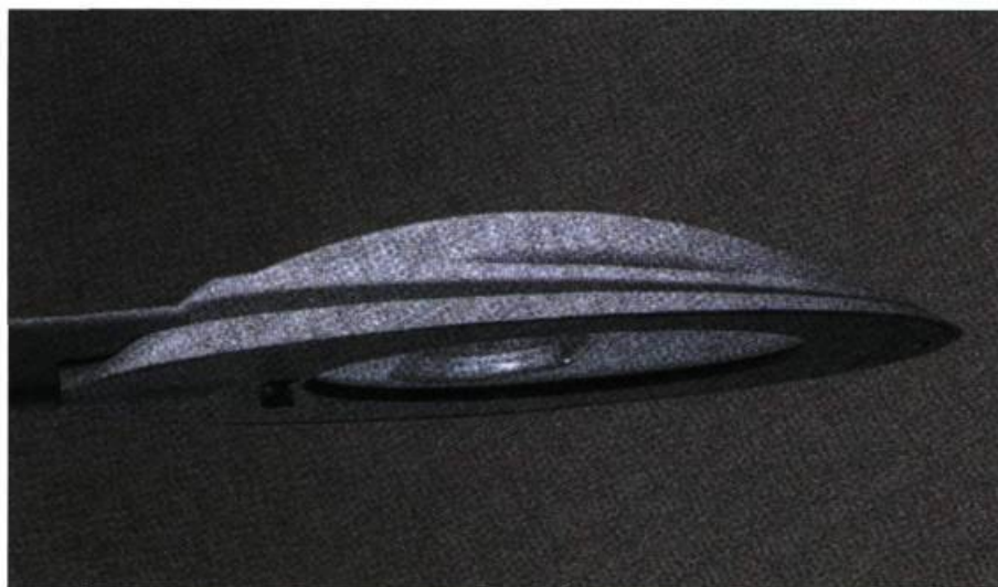
Le luminaire Hestia, Lumec-Schröder, projette la lumière vers le bas, ce qui évite les fuites lumineuses inutiles vers le ciel.

type « défilé » permettrait d'atteindre cet objectif puisqu'ils n'éclairent que vers le bas et que leur source lumineuse est cachée. Ils ne sont donc pas éblouissants et n'envoient aucun rayon lumineux directement vers le ciel.