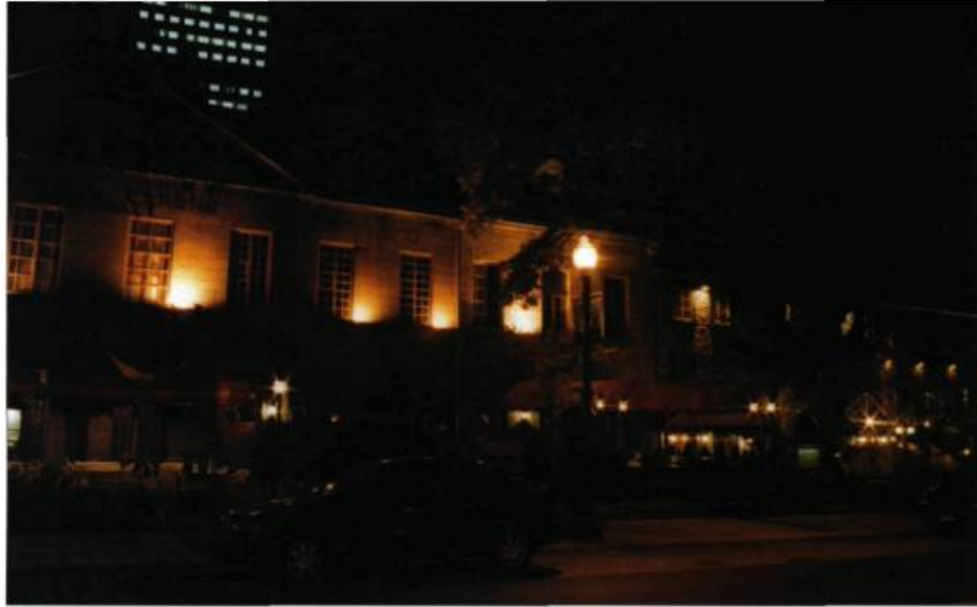
En haut, l'illumination de la terrasse Stadacona sur la Grande Allée à Québec.