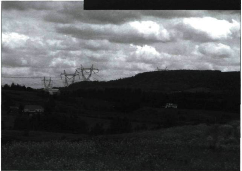
Éoliennes en milieu rural en Scanie et pylônes dans le Centre-du-Québec. Deux visages du transport d'énergie.