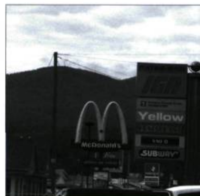
Deux approches différentes dans l'affichage : en haut, une affiche regroupant l'information à Trolhattan dans le Västra Götaland. En bas, de nombreuses affiches à Baie-Saint-Paul dans Charlevoix.