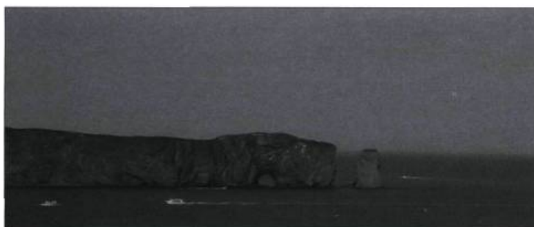
Le Québec et la Suède, deux contrées où les paysages maritimes sont omniprésents. En haut, la réserve naturelle de Ramsvikslandet.