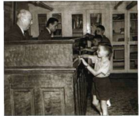
L'épargne scolaire à la Caisse populaire de Lévis en 1953.