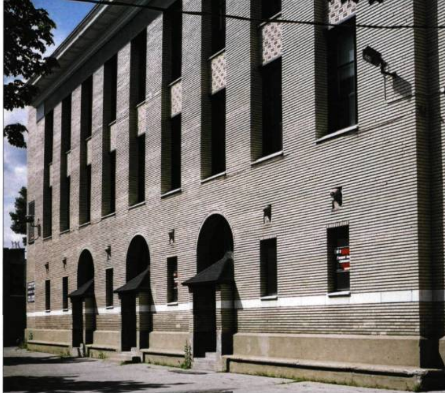
Construite en 1925, l'ancienne école Sainte-Julienne-Falconieri, à Montréal, est de l'architecte Ernest Cormier. La composition de la façade procède d'une succession de travées uniformes qui rappellent l'image du péristyle.

des préceptes classiques. Sa monumentalité caractéristique est justifiée par une idéologie selon laquelle les commandes publiques doivent contribuer à l'embellissement urbain. Après la Grande Guerre, peut-être lors de sa brève collaboration avec Marchand, Cormier propose, avec l'école Saint-Arsène, une solution où ce n'est pas le style mais la composition qui importe. Le rez-de-chaussée, qui n'est plus ici le soubassement d'une série de pilastres, est percé d'une triple arcade qui éclaire généreusement la grande salle et indique sa position centrale. La subdivision de l'élévation dévoile également le plan des classes aux étages. La façade devient ainsi le portrait de l'intérieur plu-