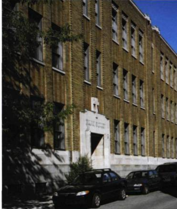
Construite en 1931, l'école Cherrier, actuel Espace-jeunesse de la rue Saint-Hubert à Montréal, est l'œuvre d'Eugène Larose. L'architecte a emprunté aux idées de l'Art déco pour la créer.

L'école Gabrielle-Souart, actuelle école Garneau, a été construite en 1916 par les architectes J. Omer Marchand, E.-A. Doucet et J.-A. Morissette. Cet édifice de la rue Papineau illustre parfaitement la maîtrise des préceptes classiques. Monumental, il participe à l'embellissement urbain.