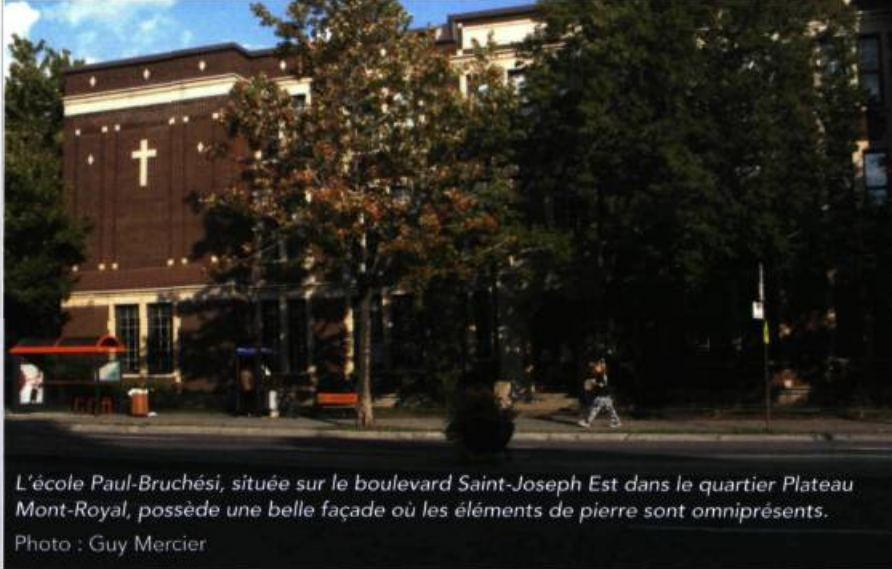
L'école Paul-Bruchési, située sur le boulevard Saint-Joseph Est dans le quartier Plateau Mont-Royal, possède une belle façade où les éléments de pierre sont omniprésents.