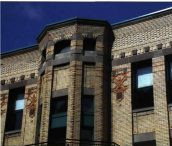
Rue Poupart, le Centre Gédéon-Ouimet présente un appareillage de brique aux motifs géométriques complexes.