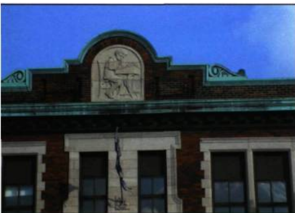
Un joli bas-relief ornant le fronton de l'école Saint-Pierre-Claver sur le boulevard Saint-Joseph.