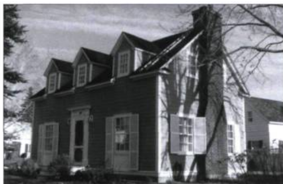
Une maison de L'Isle-Maligne aujourd'hui.