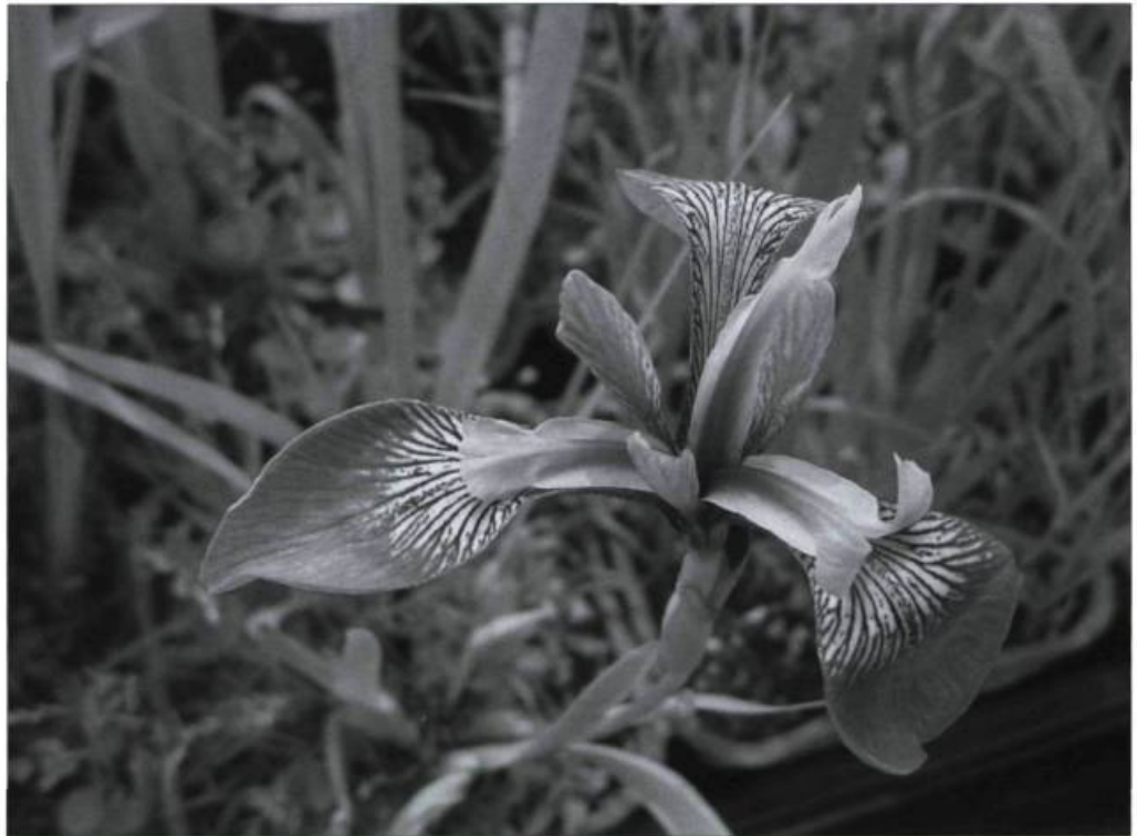
L'iris versicolore, emblème officiel du Québec, avait sa place dans les jardins de compagnies.