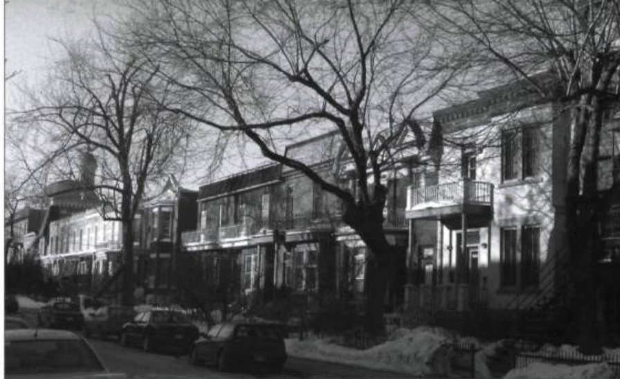
Paysage de rue : le tissu urbain des quartiers de la ville.

L'un des faits marquants de cette deuxième réunion des ateliers est certainement la réflexion sur le paysage et le bien-être individuel et social. Elle constitue l'un des principes-cadres (avec la qualité de vie) d'une notion contemporaine de paysage, soucieuse de contribuer à l'épanouis-