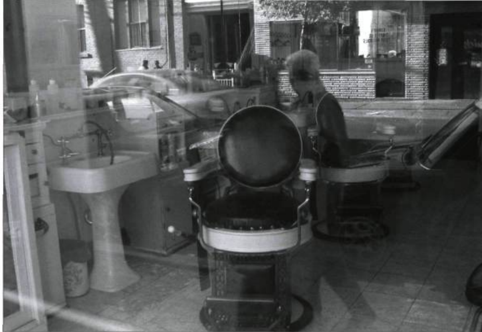
Paysage de la proximité urbaine.

nouveaux. On semble connaître le paysage que l'on veut conserver, mais on n'a aucune idée de celui qui serait à construire, ni des raisons qui inspireraient sa construction. Ne serait-il pas temps de reconnaître le paysage comme projet de société et de l'imposer à l'ordre du jour de nos gouvernements? Si le Québec peut et doit se poser cette question, de l'autre côté de l'océan, l'Europe se prépare à appliquer un ambitieux projet de paysage: la Convention européenne du paysage.