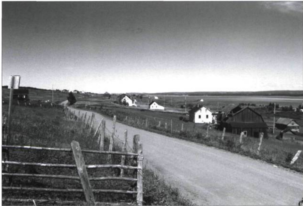
La disparition du zonage agricole sur l'île Verte a forcé le milieu à développer une vision globale du paysage et à créer des outils de gestion de son évolution.

La reprise en friche des paysages champêtres est aussi une menace au maintien de la vue sur le paysage maritime. Elle découle de la quasi-disparition des activités agricoles. Les seuls outils réglementaires ne peuvent rien contre cette