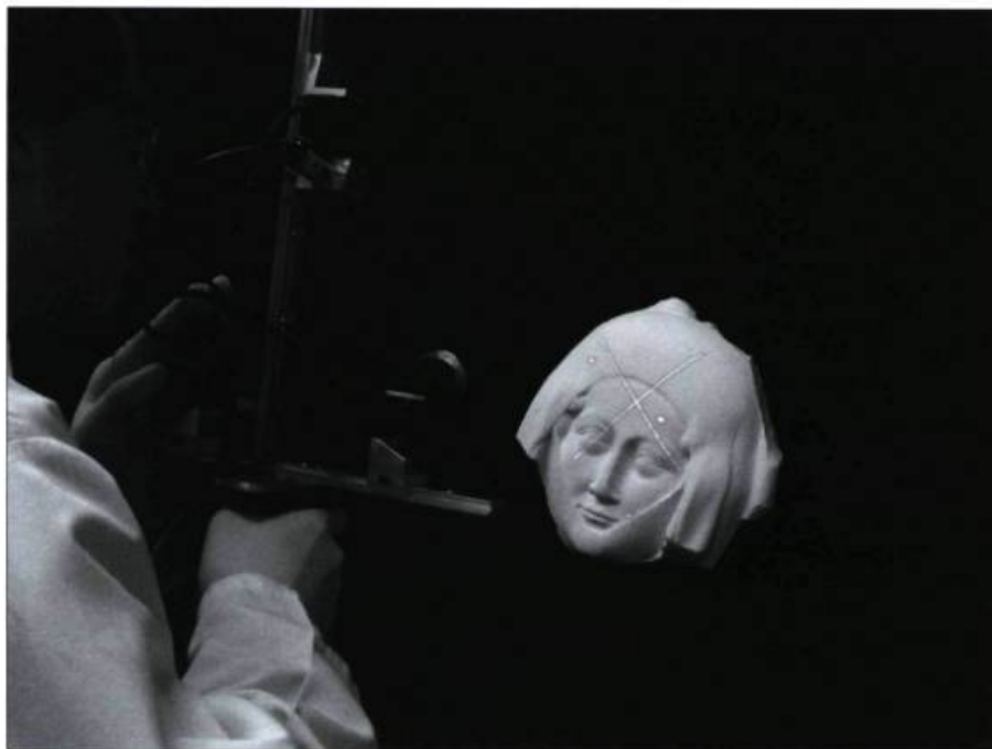
Un chercheur du Laboratoire de vision et systèmes numériques (LVSN) de l'Université Laval réalisant des expériences de numérisation à partir d'une pièce des collections de l'Université.