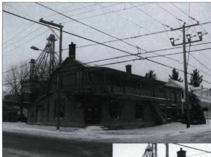
Le magasin général d'Upton au début du siècle et maintenant après restauration.