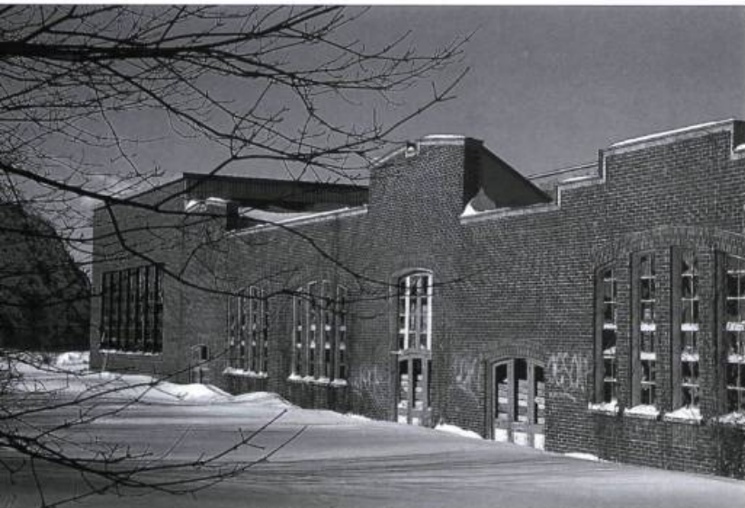
L'usine L'Hoir à l'anse Hadlow à Lévis.