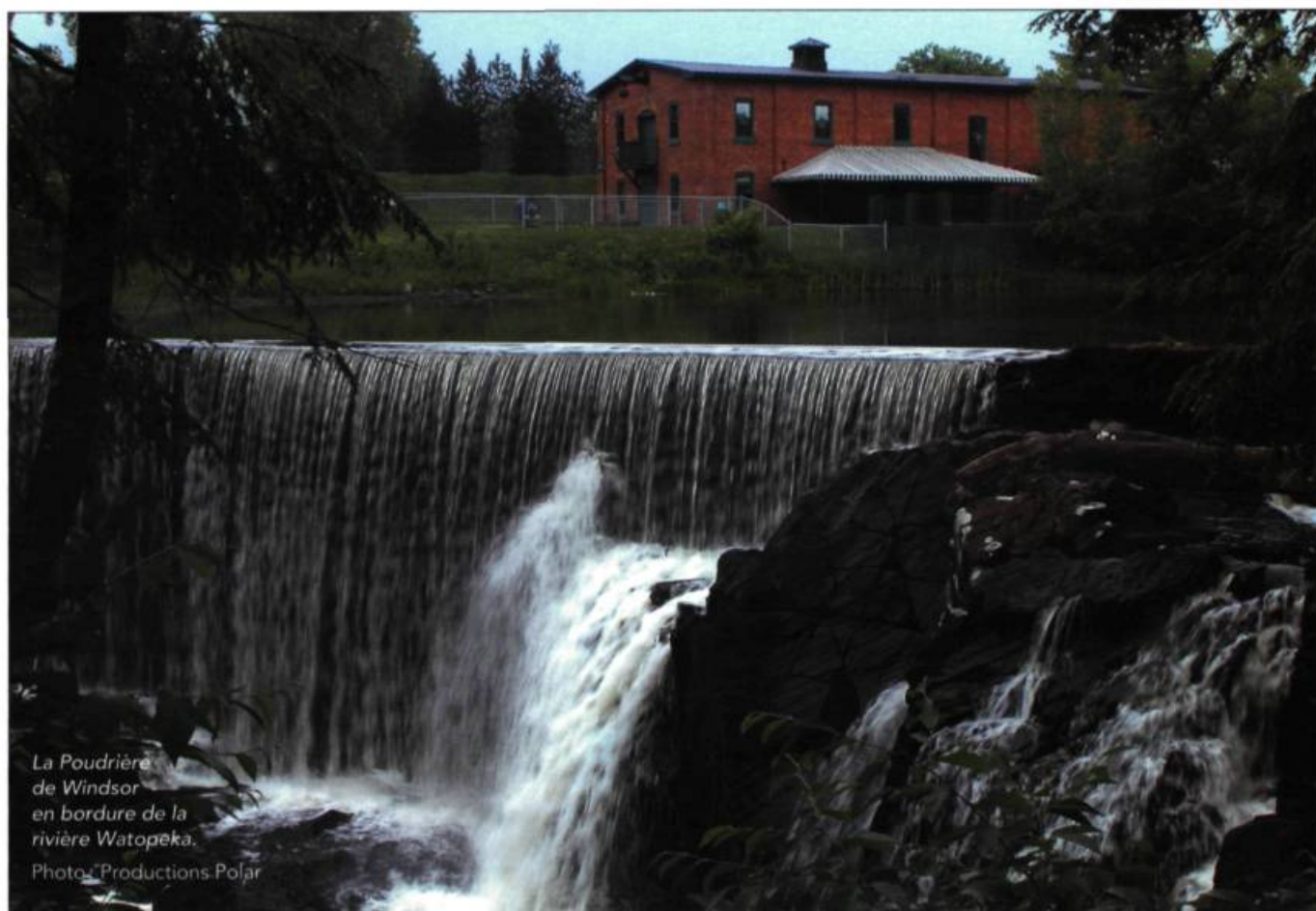
La Poudrière de Windsor en bordure de la rivière Watoupeka.

On n'imagine pas découvrir un patrimoine industriel d'intérêt à l'intersection de deux routes de gravier ou à l'entrée d'un village. Les éléments les plus spectaculaires sont généralement urbains. La campagne n'est pourtant pas en reste. Dans le Val-Saint-François, des témoins significatifs et originaux du passé industriel animent le paysage.