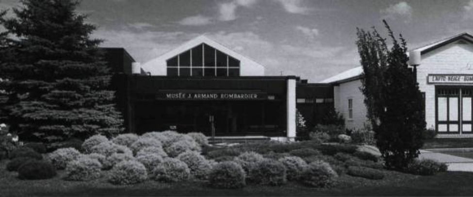
Le Musée J. Armand Bombardier à Valcourt est l'un des premiers établissements dédiés à la muséologie technique et industrielle au Québec.